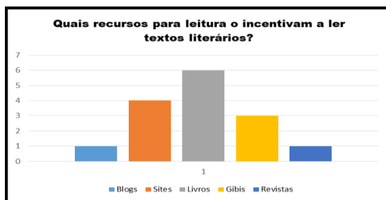
Gráfico 2: Quais recursos para leitura o incentivam a ler textos literários?