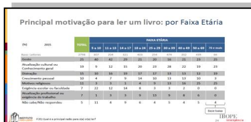
Figura 5: Motivação para ler por faixa etária.