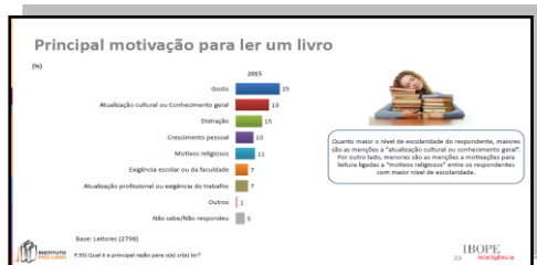
Figura 4: Principal motivação para ler um livro.