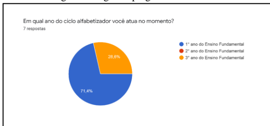
Figura 3: Segunda pergunta da entrevista.