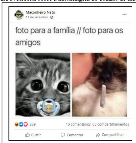
Figura 3: Recorte sobre a autoimagem do usuário de maconha.

Outro ponto relevante diz respeito às relações sociais construídas pelos adolescentes com a escola. A seguir, a figura 3 demonstra o ensinamento do professor para que os alunos aprendam a manusear o cigarro de maconha, o que merece comentários posteriores à análise: