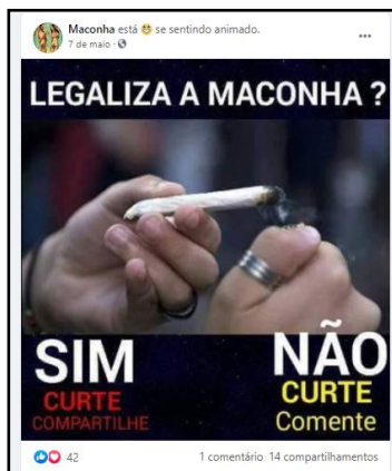
Figura 1: Recorte com opinião sobre a legalização da maconha.