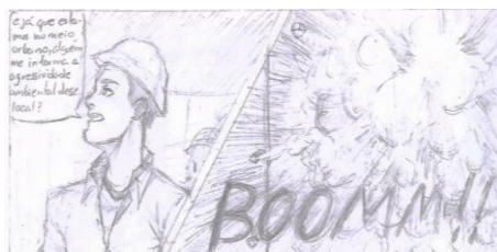
Fonte: Fragmento de HQ produzida pelos alunos.

O uso da onomatopeia, elemento comum nos quadrinhos, se fez bastante presente nas HQs, como ilustrada na Figura 2, “BOOMMM!!”, representativa do som de explosão de uma estrutura. Outro fator percebido foi a figura do narrador (Figura 3 (a)), com o uso de balão de narração sem o uso de apontador “A vilã mais temida (...)” e “(...) seu maior ini-