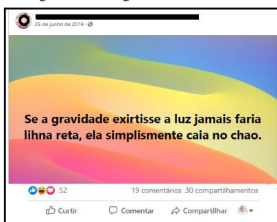
Figura 1 – Postagem com erros de escrita.

Nesta perspectiva, o presente estudo demonstra na Figura 1, uma postagem cuja motivação era a demonstração de aspectos ideológicos e teorias científicas, entretanto, ocorrem problemáticas quanto ao padrão culto, conforme segue: