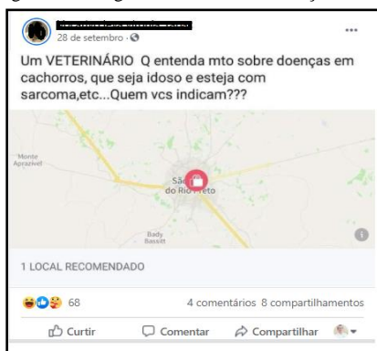
Figura 2: Postagem com erro de construção frasal.

Outro ponto a ser demonstrado fica evidente na Figura 2, uma postagem cuja motivação é o pedido de recomendação de profissional da área de medicina veterinária, porém ocorrem falhas que levam o texto a fugir da linguagem padrão, gerando também ambiguidade, conforme se observa a seguir: