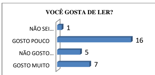
Gráfico 1: Você gosta de ler?

Para realizar uma pesquisa-ação em uma turma de 9º ano do Ensino Fundamental de uma escola da rede municipal de Seropédica, Rio de Janeiro, foi feita uma investigação inicial, através de um questionário, do qual se destacam os seguintes resultados: