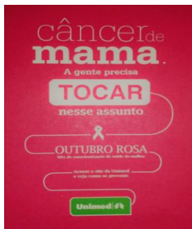
Figura 5: Campanha.

Fonte: Cereja; Viana e Damien (2016, p. 314).