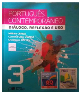
Figura 1: “Português contemporâneo: diálogo, reflexão e uso”.