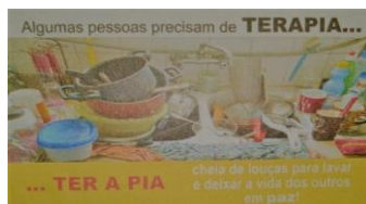
Figura 4: Cartaz.