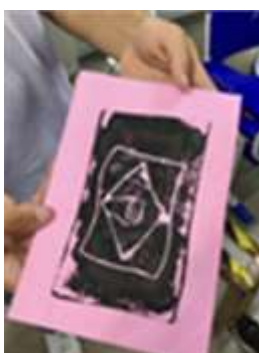
2: Capa de folheto.