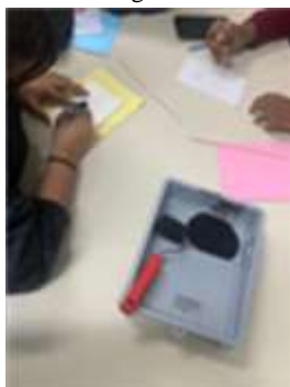
Figura 1: Produção de Figura isogravura.