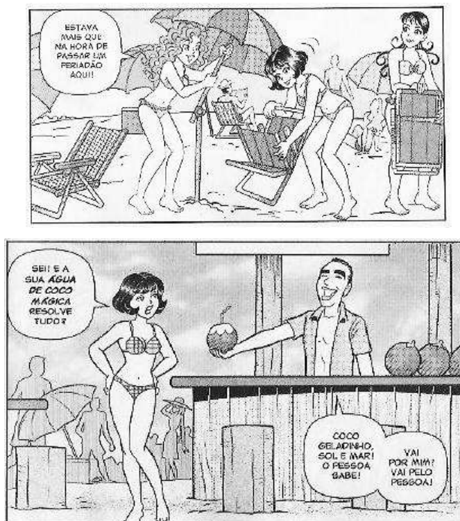
Fig. 7: Efeito de realidade. Turma da Mônica Jovem , nº 62, p. 11, 29.

Observe-se a Fig. 7 , por exemplo. As imagens trazem o cenário de uma praia ( frame ), semelhante ao real, que é capaz de evocar todo um imaginário social do leitor, e trazer a sua mente situações que podem estar ligadas a esse quadro, situações essas que se desenrolarão adiante, como montar cadeiras e barracas de praia e tomar água de coco. Todas essas ações fazem parte desse quadro (literalmente, pois os quadrinhos são expressos por quadros – frame , em inglês) e criam um efeito de realidade para o leitor.