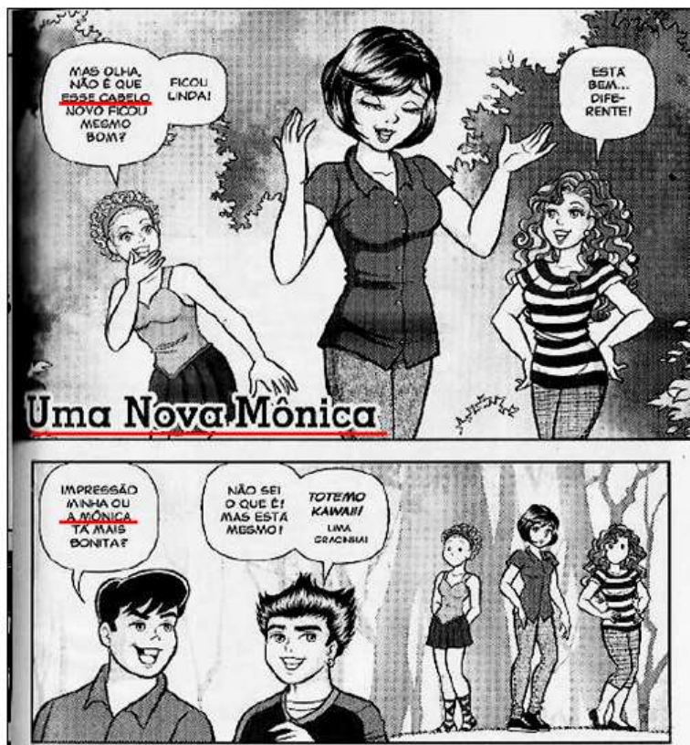
Fig. 1: Atualização e Designação. Turma da Mônica Jovem , nº 61, p. 45.

Na Fig. 2, aparece uma imagem em forma de sombra, criando efeito de suspense pela indeterminação (Cascão não vê com quem está falando).