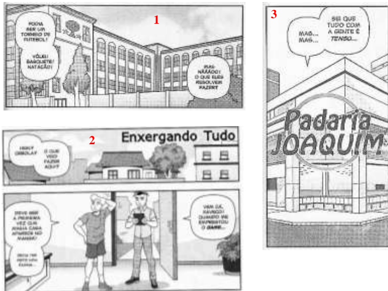
Fig. 3: Localização no espaço.

Turma da Mônica Jovem nº 41, p. 5; nº 59, p. 105; nº 61, p. 15.