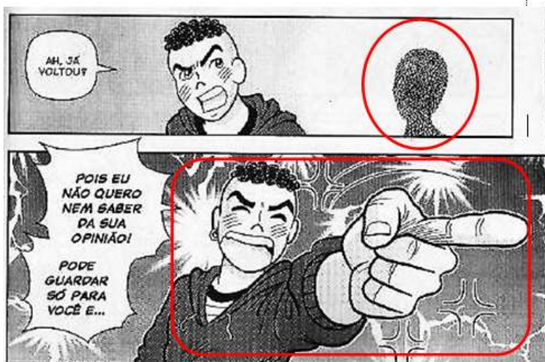
Fig. 2: Indeterminação, designação e dependência nas imagens. Turma da Mônica Jovem , nº 41, p. 25.

Quando Cascão aponta para a pessoa (achando que é o Cebola, mas posteriormente é revelado que se trata da Magali), a imagem contribui para a nomeação por meio das categorias: designação (quando mostra de quem é a opinião que ele não quer) e dependência (numa apreciação negativa).