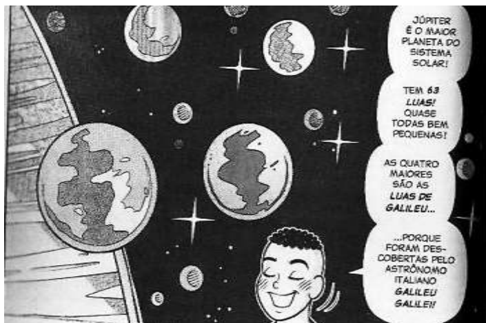
Fig. 6: Efeito de saber. Turma da Mônica Jovem , nº 41, p. 116-117.