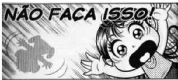
Fig. 8: Chibi. Turma da Mônica Jovem , nº 41, p. 30.

tam-se às referências feitas nas aventuras (uso de intertextualidade), à expressão de emoções e ao uso de chibis . Chibi é um termo japonês para definir algo “pequeno”. É um desenho bastante estilizado, com cabeça no mesmo tamanho dos corpos, geralmente sem nariz e a boca nem sempre finalizada. Os chibis normalmente são usados para dar um efeito cômico ou mais sentimental, como pode ser observado no exemplo a seguir (Fig. 8):