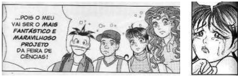
Fig. 5: Qualificação verbal e icônica. Turma da Mônica Jovem , nº 41, p. 11 e 26.

No conteúdo da revista, é possível observar a qualificação verbal , na definição de Cascão de como será seu projeto da Feira de Ciências, e a qualificação icônica , na imagem da Magali ( Fig. 5 ), que mostra que a personagem está triste.