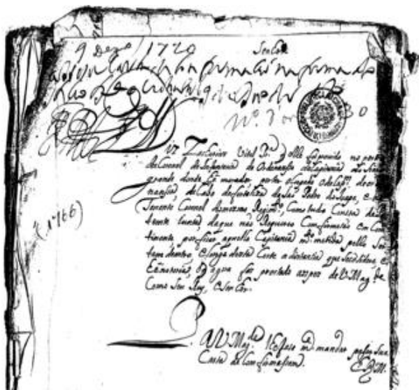
Fotograma 0024.TIF (ARQUIVO, CD-ROM 1, 001/001/0024): como está no CD-ROM