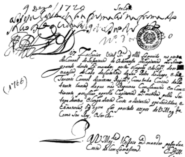
Fotograma 0024.TIF (ARQUIVO, CD-ROM 1, 001/001/0024): como ficou depois de editado.