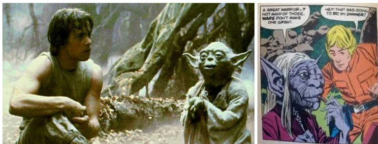
Versão apresentada nos cinemas ao lado da versão apresentada para os quadrinhos a partir de um roteiro antigo

O mesmo se repetiu no segundo filme, O Império Contra-Ataca . No mesmo ano do lançamento do filme as livrarias receberam a versão romaneada por Donald F. Glut. Um dos personagens aparece com uma forma muito diferente do que foi apresentado no cinema, mas nas reedições dos quadrinhos, por exemplo, o personagem foi redesenhado para ficar o mais próximo possível da versão das telonas, conforme imagens abaixo: