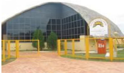
Memorial Indígena

A aldeia disponibiliza uma escola do pré a quinta série, um CE-INF (Centro de Educação Infantil), um Memorial Indígena que faz parte da rota turística do City Tour de Campo Grande – MS, cuja finalidade é expor aos visitantes seus artesanatos e contar um pouco de sua história.