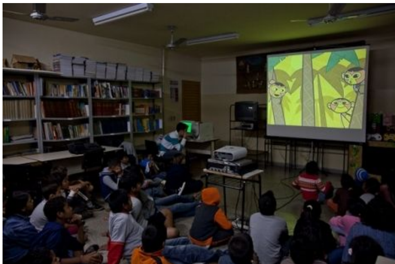
Biblioteca da escola