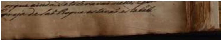
Figura 4 – Detalhe do fólio 311r do Códice 132