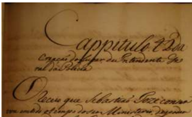
Figura 6 – Detalhe do fólio 151r do Códice 132