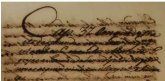
Figura 6 – Detalhe do fólio 111r do Códice 132

algumas vezes, de um maior espaçamento entre essas partes (Vide Figura 7 ). Cada capítulo é iniciado na mesma página em que termina o seu predecessor, havendo espaço útil, ou em nova página, indistintamente, sendo, por vezes, descartado o verso do fólio predecessor, como ocorre com o capítulo 82, que se inicia no fólio 347r, ficando o 346v em branco.