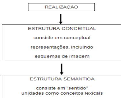
Figura 1 – Da incorporação ao significado linguístico.

Ao darmos sentidos novos a itens lexicais, a estrutura conceitual se utiliza de nossa experiência corporificada, pois a estrutura semântica reflete essa estrutura conceitual. Evans e Green apresentam um quadro para explicar esta construção (p. 177, 2006):