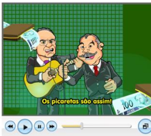
Figura 1 7

A charge Borboletas apresenta imagens do tipo demanda, o que implica um convite do participante ao observador, convidando-o à interação a partir do olhar, na maioria das cenas 6 :