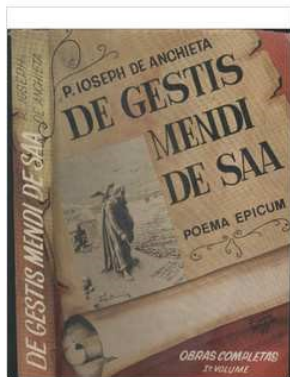
Imagem 4. Edição de 1970, De GestisMendi de Saa .

A terceira e última edição de Armando Cardoso do poema foi publicada em 1986, no contexto do processo de beatificação de Anchieta. Corrigindo os poucos lapsos da edição anterior, mantém o texto estabelecido original em latim e a tradução poética, sendo mais relevante nessa edição a série de livros que a sucedeu e que compõem outros volumes das obras completas de Anchieta. Com o avanço das edições, pode se aqulitar o valor multidisciplinar dos documentos do Brasil quinhentista, ainda que fosse apenas uma civilização colonial incipiente. A edição final apresenta pouco mais de três mil versos em latim renascentista, em que se faz notar a emulação de autores clássicos e um conhecimento teológico erudito, condizentes com a educação humanística renascentista, cultivada nos reinos absolutistas europeus.