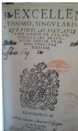
Imagem 1. Frontispício da editio princeps de 1563.