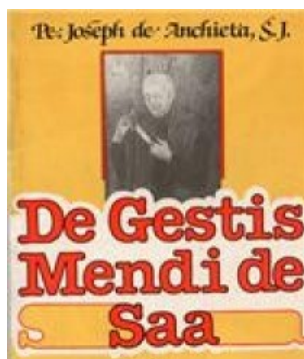
Imagem 5. Edição de 1986, De GestisMendi de Saa .

A terceira e última edição de Armando Cardoso do poema foi publicada em 1986, no contexto do processo de beatificação de Anchieta. Corrigindo os poucos lapsos da edição anterior, mantém o texto estabelecido original em latim e a tradução poética, sendo mais relevante nessa edição a série de livros que a sucedeu e que compõem outros volumes das obras completas de Anchieta. Com o avanço das edições, pode se aqulitar o valor multidisciplinar dos documentos do Brasil quinhentista, ainda que fosse apenas uma civilização colonial incipiente. A edição final apresenta pouco mais de três mil versos em latim renascentista, em que se faz notar a emulação de autores clássicos e um conhecimento teológico erudito, condizentes com a educação humanística renascentista, cultivada nos reinos absolutistas europeus.