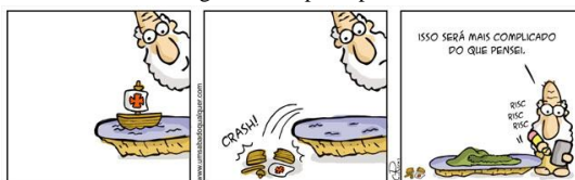
Figura 2: No princípio 4.

Fonte: RUAS, Carlos. Um Sábado Qualquer . 2020.