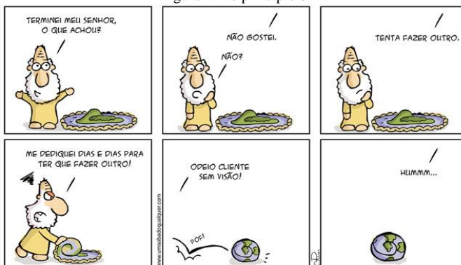
Figura 4: No princípio 6