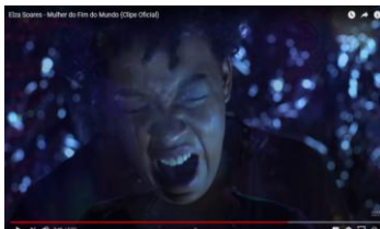
Figura 9: Trecho do videoclipe “A mulher do fim do mundo”.

As lágrimas choradas por Elza refletem a experiência de uma mulher que tem uma força praticamente inabalável, com uma vontade incansável de cantar até que o último facho de luz a nos iluminar se apague de vez.