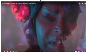
Figura 10: Trecho do videoclipe “A mulher do fim do mundo”.