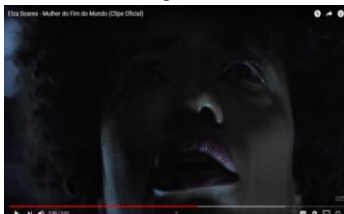
Figura 6: Trecho do videoclipe “A mulher do fim do mundo”.