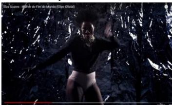
Figura 7: Trecho do videoclipe “A mulher do fim do mundo”.