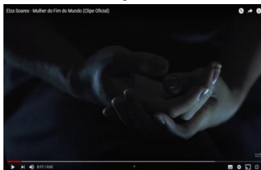
Figura 5: Trecho do videoclipe “A mulher do fim do mundo”.

Na sequência, têm-se as mãos sobrepostas, como se estivessem atadas e um detalhe chama atenção em nossa leitura: o esmalte das unhas está descascando. Relacionando isso com a vida de Elza, esse elemento é típico das mulheres que executam trabalhos domésticos, como aqueles que Elza e a mãe executavam: Lavar roupas e outros trabalhos domésticos como faxina e cuidados com as louças. Atividades que executavam para auxiliar no sustento da família.