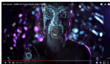
Figura 8: Trecho do videoclipe A mulher do fim do mundo .

Assim como o samba, que também tem influência das religiões de matriz africana, percebe-se no videoclipe outra marca dessa ancestralidade africana que Elza quer ressaltar: a máscara utilizada pelo ator em cena.