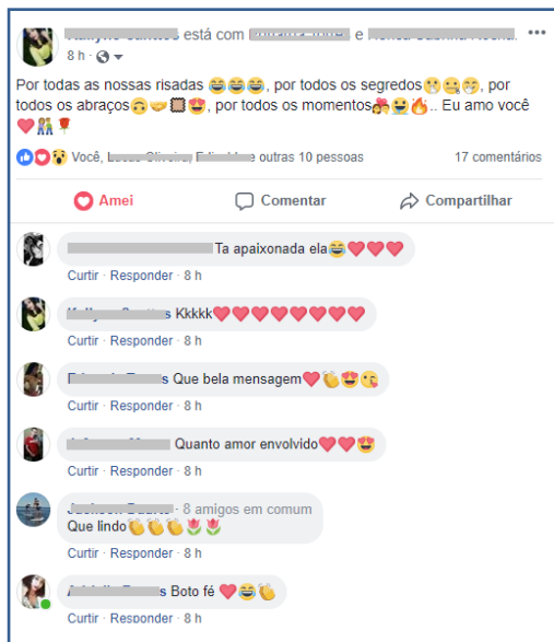
Figura 1: Recorte de postagem com ênfase na linguagem não verbal.