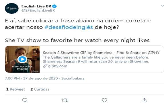
Figura 2: Tweet do perfil @EFEnglishLiveBR.

@EFEnglishLiveBR 3 – voltado para a divulgação de seu curso on-line por meio de publicações a respeito da língua inglesa –, a fim de demonstrar que o tweet é um gênero do discurso materializado no suporte Twitter . Vejamos, a seguir, o tweet investigado: