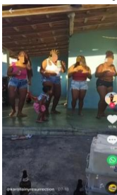
Figura 2: Vídeo curto do TikTok com criança dançando ao lado de adultos

Este segundo vídeo, postado em 18 de julho de 2021, obteve 392.300 visualizações e 17.700 curtidas, ou seja, obteve um público de mais de trezentas mil pessoas que assistiram. Quanto à composição, o vídeo é composto por quatro mulheres adultas e uma criança do sexo feminino, no qual todas estão dançando ao som da canção de funk