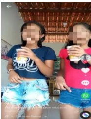
Figura 3: Vídeo curto do TikTok com pré-adolescentes dançando/encenando.

Quanto ao terceiro vídeo escolhido para as análises, publicado em 29 de agosto de 2021, este obteve poucas visualizações, sendo vinte e duas visualizações ao todo. Entretanto, o vídeo chama atenção por ser apresentado por crianças maiores, no caso, pré-adolescentes e, além disso, a conta que publicou o vídeo está no nome de uma das crianças, sendo possível encontrar mais de 15 vídeos das duas meninas dançando/encenando canções de funk, além de outros vídeos com outras crianças que também dançam/encenam canções de funk. Nesse viés, apesar de não conhecer a idade certa das meninas expostas no vídeo, é possível constatar que uma das meninas tem a sua própria conta criada no aplicativo, sendo um procedimento consentido pelos responsáveis. Além disso, os vídeos publicados são gravados todos em uma casa.