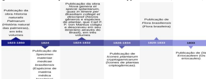
Figura 2: Linha do tempo de Carl Friedrich Philipp von Martius (1821–1833).