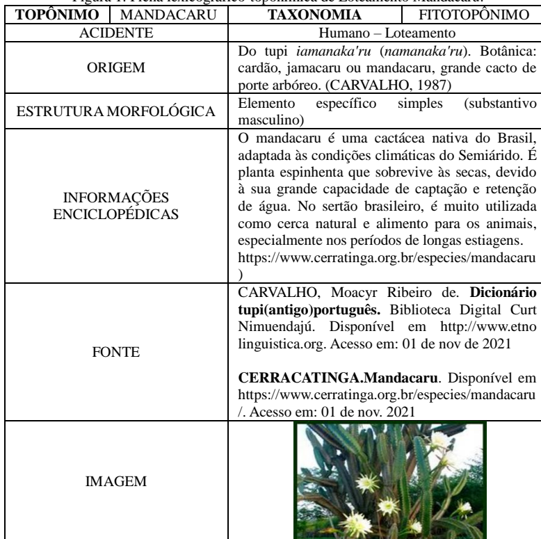
Figura 1: Ficha lexicográfico-toponímica de Loteamento Mandacaru.