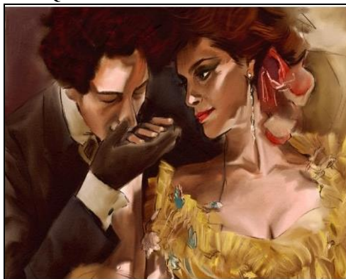
Fig. 1: Cartaz Dom Casmurro

Marido passa a vida inteira sem saber se a mulher o traiu com seu melhor amigo Quer saber mais? Leia Dom Casmurro .