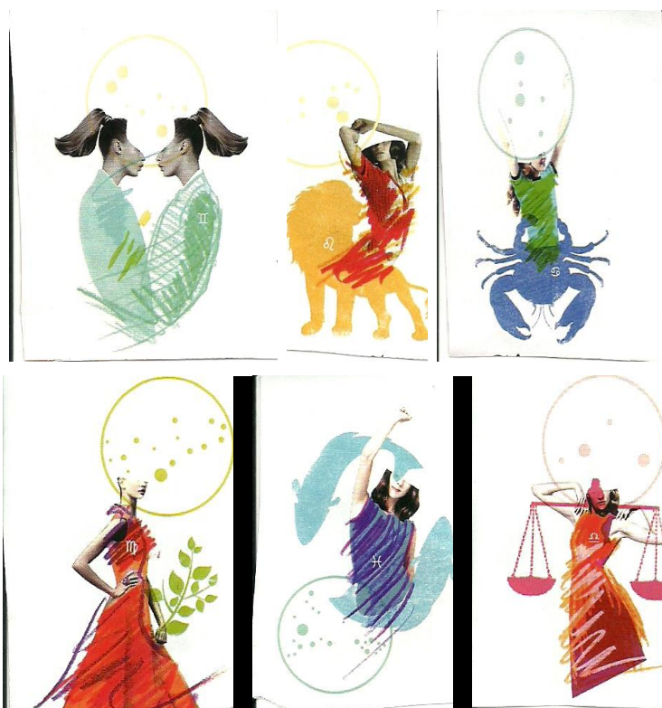
Fig.2 Imagens do horóscopo da revista Cláudia , nov. 2013.

interpretante final, ligado ao hábito, à lei, é a significação, é o signo. Nota-se que todas as figuras trazem a representação que o objeto quer representar, para que a semiose se estabeleça, na primeira figura tem-se o signo de gêmeos representado por duas figuras de mulher, no signo de leão uma mulher e atrás um leão, em câncer um caranguejo, em libra uma mulher segurando aos ombros uma balança, em virgem uma mulher com um ramo de folhagem nas mãos, e em peixes, uma mulher entre dois peixes em oposição. Além disso, todas as figuras dos signos do zodíaco trazem a roda que simboliza a dinâmica da vida.