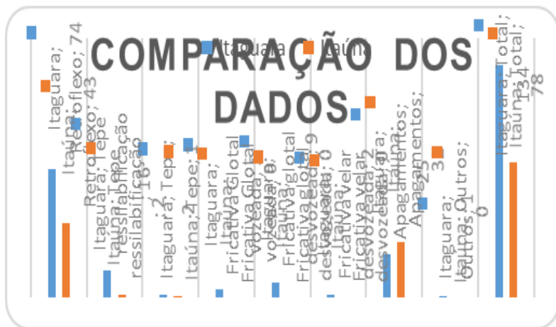
Gráfico – Comparação dos dados

Tendo em vista a possibilidade de uma mudança acontecendo no falar itaguarense, faz-se necessário descrever, ainda que brevemente, como se caracteriza a variação estável , ou mudança em progresso .