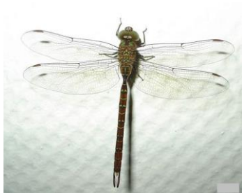
Figura 1 – Ilustração libélula