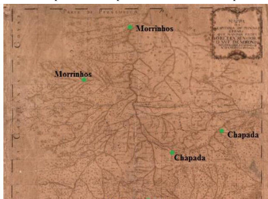
Figura 04: Geomorfotopônimos na Capitania de Minas Gerais: mapa de Rocha (1777a).

O mapa, a seguir, ilustra a presença de alguns geomorfotopônimos, inclusive, formados pelo designativo “Morro”, na Capitania mineira: