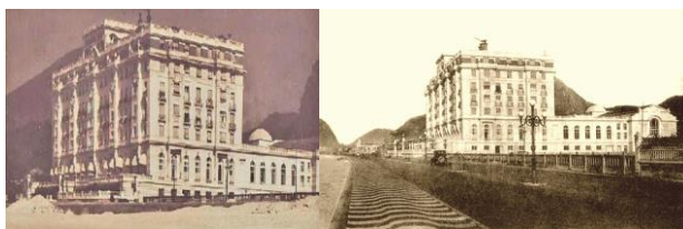
100 anos dae existência do Copacabana Palace